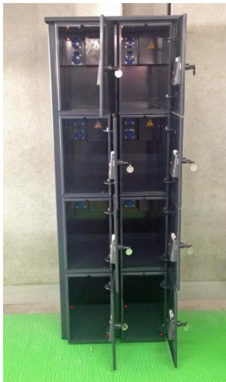
NSA Lockerkast 2x4