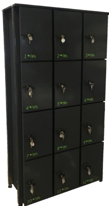
NSA Lockerkast 3x4