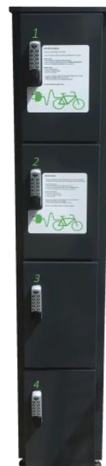
NSA Lockerkast 1x4 Pincode